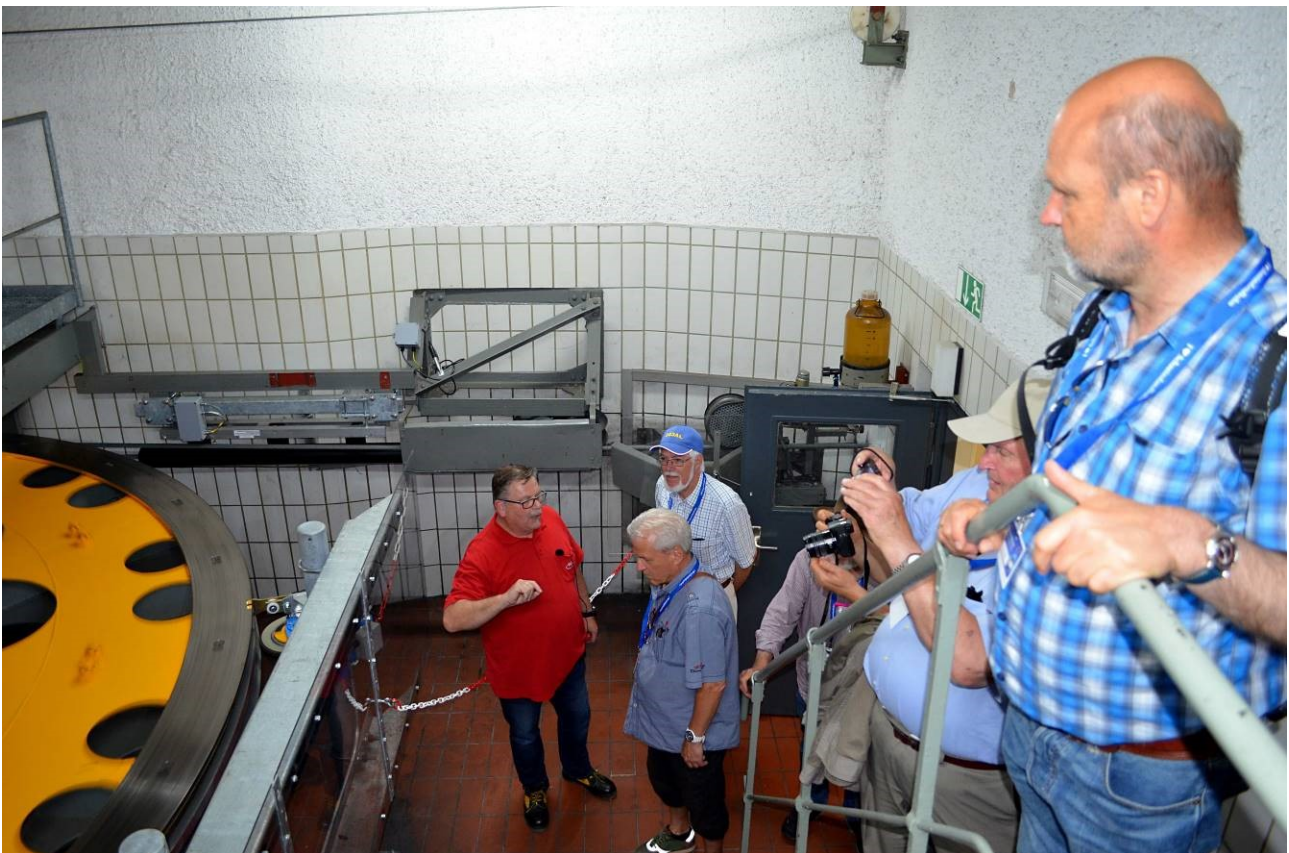
Foto 3: Die von einem starken Motor angetriebene Treibscheibe (links), über die das Tragseil in Bewegung gehalten wird.